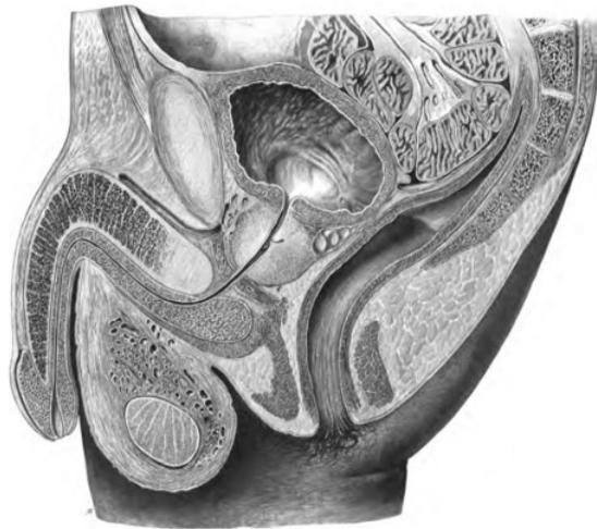
Figura 1 – Corte sagital da pelve. Pode-se observar a próstata localizada abaixo da bexiga, envolvendo a uretra.

A próstata possui um istmo que se localiza anteriormente à uretra, possui composição fibromuscular e no qual as fibras musculares representam a continuação superior do músculo esfíncter externo da uretra para o colo da bexiga.